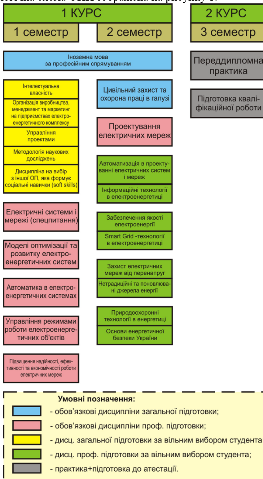
Рисунок 1 – Структурно-логічна схема ОПП

Структурно-логічна схема ОПП зображена на рисунку 1.